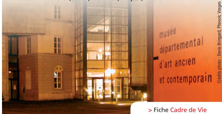
Crédits photo : Denis Bringard, Phovoir, Vosges Développement - Réalisation : Piment Noir - Mise à jour Novembre 2009